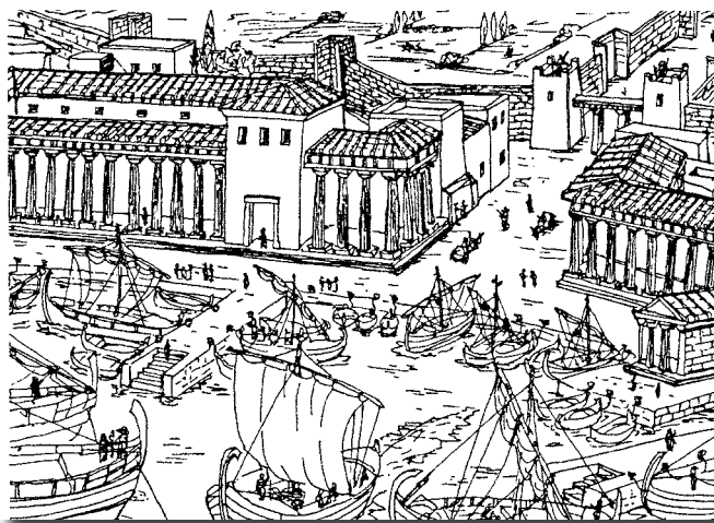
Porto del Pireo, con la parte conclusiva delle Lunghe Mura (da: L. MIRAGLIA, Athènes , 1, 1999).

Tale divergenza nelle finalità e nelle metodologie didattiche potrà apparire naturale e quindi inevitabile. Di fatto, non si intende qui sostenere la necessità di una riforma nell'insegnamento delle lingue classiche tesa a plasmare studenti in grado di parlare il greco e il latino quasi fossero lingue moderne, anziché semplicemente di comprendere testi letterari prodotti in quegli idiomi. Sarebbe impervio giustificarne la proficuità. Resta il fatto, e da questo intendo partire nella mia riflessione, che la stessa capacità passiva di comprensione del testo greco e latino è fra gli alunni d'oggi gravemente precaria. Ciò dipende da una serie di fattori convergenti che appaiono – questo sì – strettamente connessi alla metodologia adottata nell'insegnamento delle due lingue, e nei quali la responsabilità degli studenti dev'essere rubricata come di secondo grado , perché conseguente e subordinata a quella degli insegnanti che tale metodologia adottano.