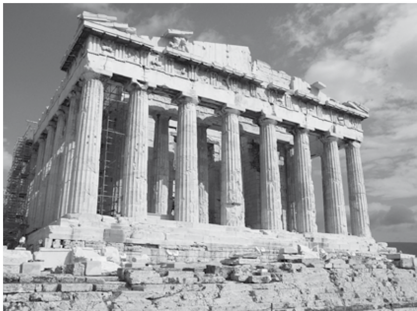
Tempio di Athéna Parthénos.

studieranno solo per le temutissime “provette” dedicate. Panorama troppo fosco? Tragicomico? Non meno dell’altro possibile scenario, evocato dai docenti che credono fermamente nella trasferibilità pura del paradigma didattico delle lingue moderne a quelle antiche. Costoro entrano in classe esordendo con «Χαίρετε, ὦ φίλοι μαθηταί. Πῶς ἔχετε;» e attendono il feedback degli studenti «Χαίρε, ὦ διδάσκαλε. Καλῶς ἔχομεν». Cercano in sostanza di instaurare un dialogo in lingua, perseguendo una competenza attiva che gli allievi potranno trovare curiosa, esotica, divertente ma che, in assenza di occasioni esercitative extrascolastiche e di reale proficuità, rimarrà fatalmente confinata fra le quattro mura della classe.