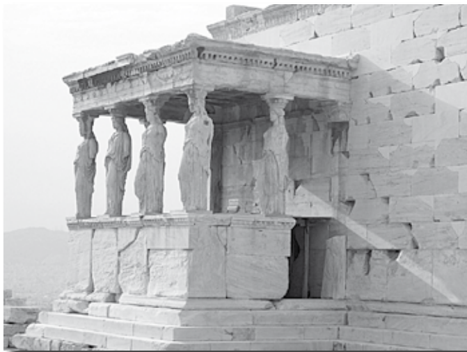
Portico delle Cariatidi, a Nord dell'Eretteo. Foto Daniela Corso.

degli allievi e far leva su di esso; il testo introduce a poco a poco tutti i punti più importanti di morfologia e sintassi indispensabili per comprendere gli scrittori antichi;