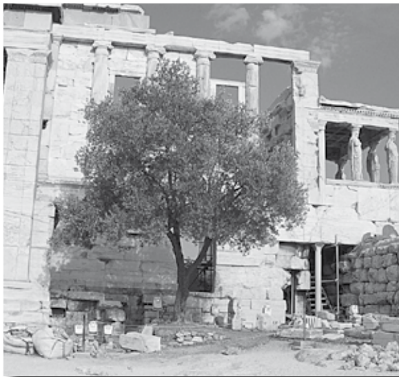
Retro dell'Eretteo e Pandrosion, che ospita l'ulivo sacro di Atena.